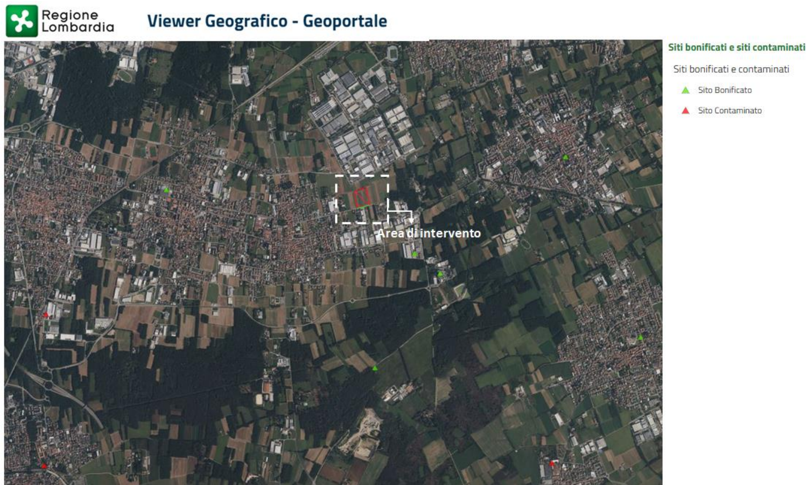
Figura.1 Estratto di mappa da Geoportale Regione Lombardia – Siti bonificati e Siti contaminati, con identificazione delle opere in progetto